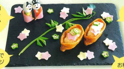
「お稲荷さん」七夕バージョン