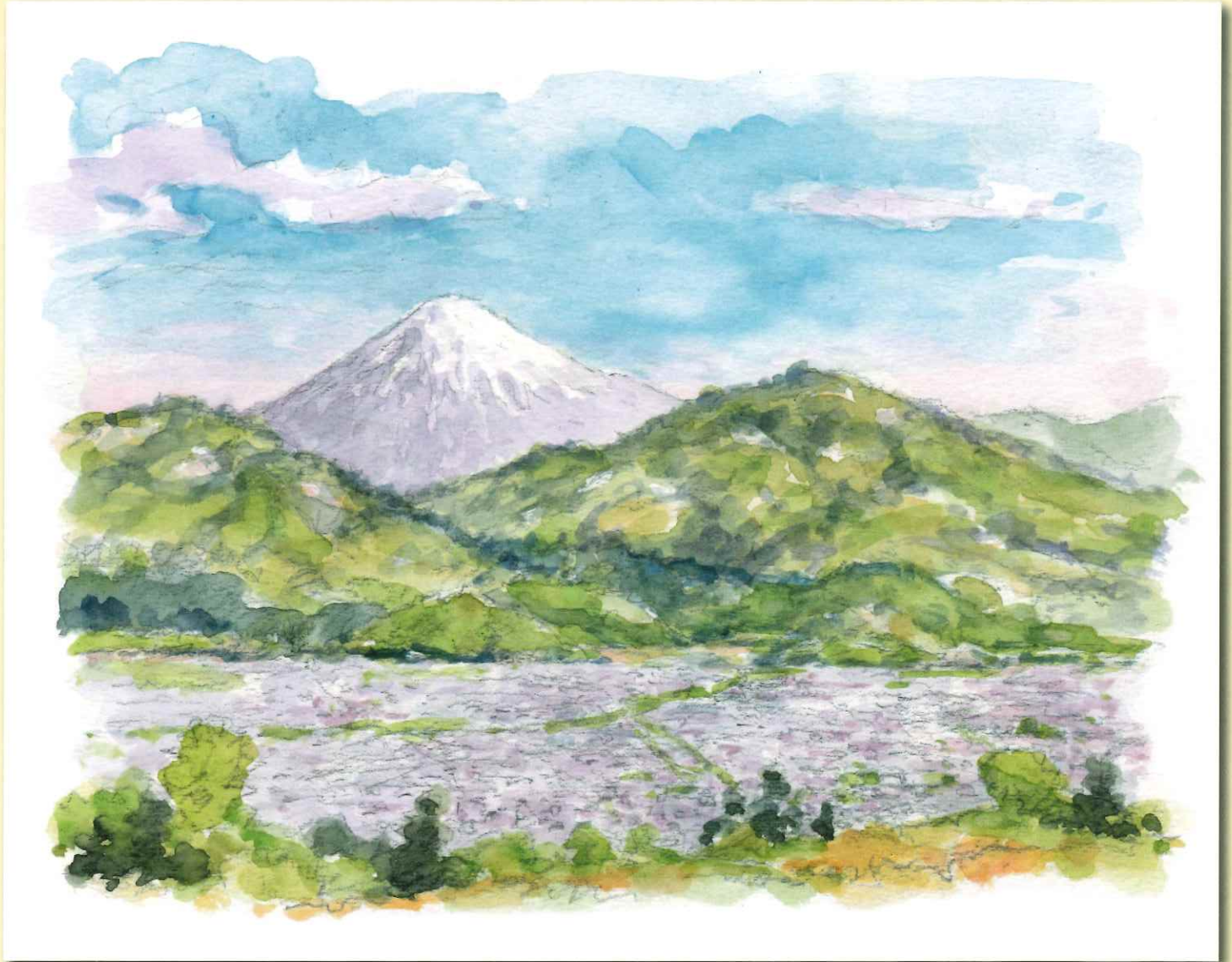
「富士見平からの富士山（若王子）」